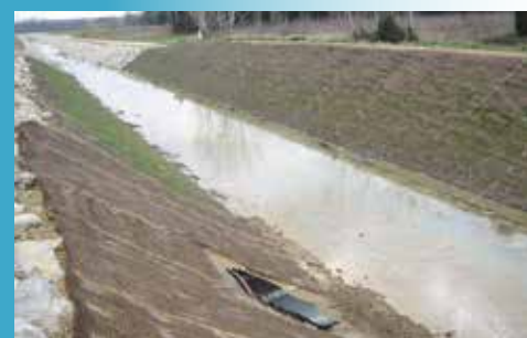
VMAX C350® AVEC DÉBUT DE VÉGÉTALISATION