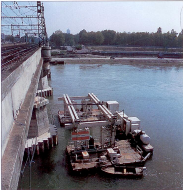
Viaduc de St-Clair (69)

Ce traitement conçu par la S.N.C.F. après concertation avec le Laboratoire National Hydraulique de CHATOU (LNH - EDF) et le LRPC d'ANGERS, a pu démontrer sa grande fiabilité lors de la crue centennale de 1982.