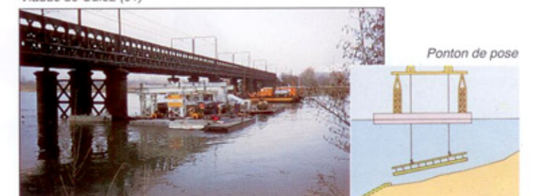
Viaduc de Culoz (01)

Après mise en place précise, un système hydraulique permet de libérer simultanément toutes les suspentes.